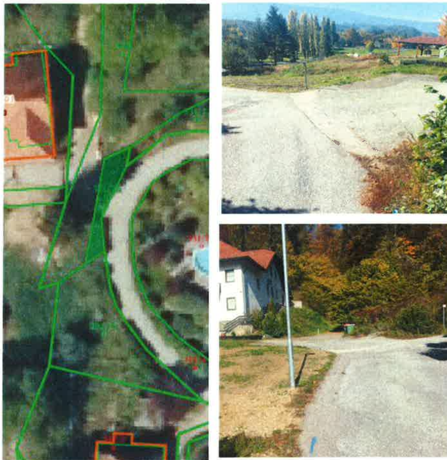
Slika 5, 6 in 7: Zemljišče k.o. 635 Brestrnica, parcela 331/76