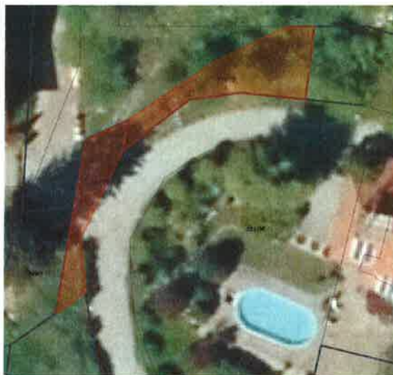
Slika1: kartografski izris – predmetni nepremičnini sta označeni z rdečo barvo