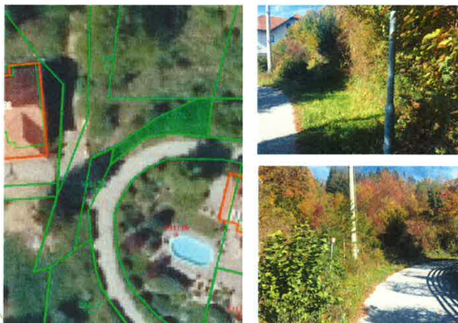
Slika 2, 3 in 4: Zemljišče k.o. 635 Brestrnica, parcela 331/75